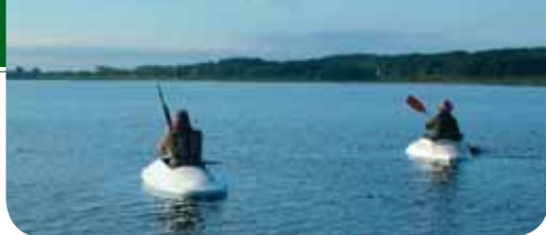
Her aktion ved blishønejagten.